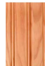
Profil mouchette sur lames en pin Métropolitain, en pin d'Orégon et sur bois exotique